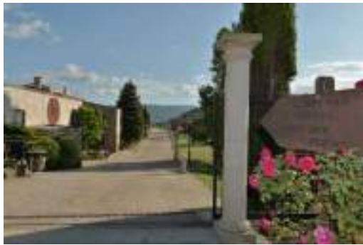
Acceso principal a la bodega.