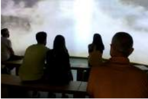
Sala de proyección.