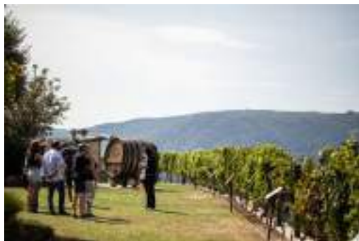
Espacio variedades autóctonas.