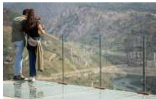
Terraza sobre el cañón del Sil.