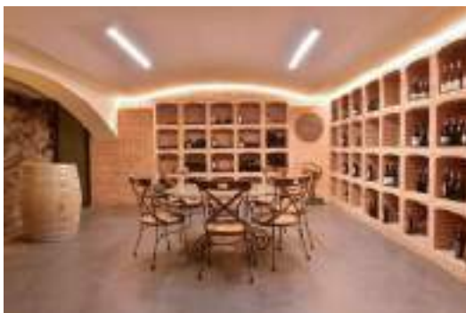
Sala de barricas.