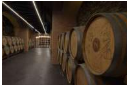
Túnel de barricas.