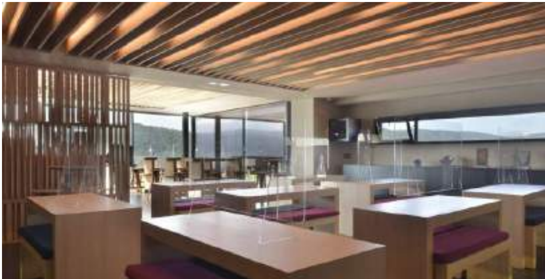
Sala de catas.