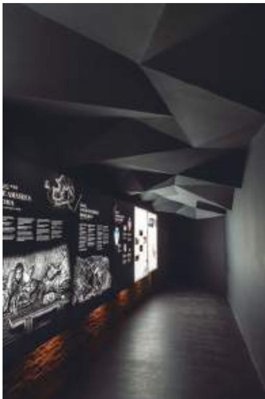
Túnel del tiempo.