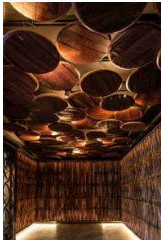
Sala de duelas.